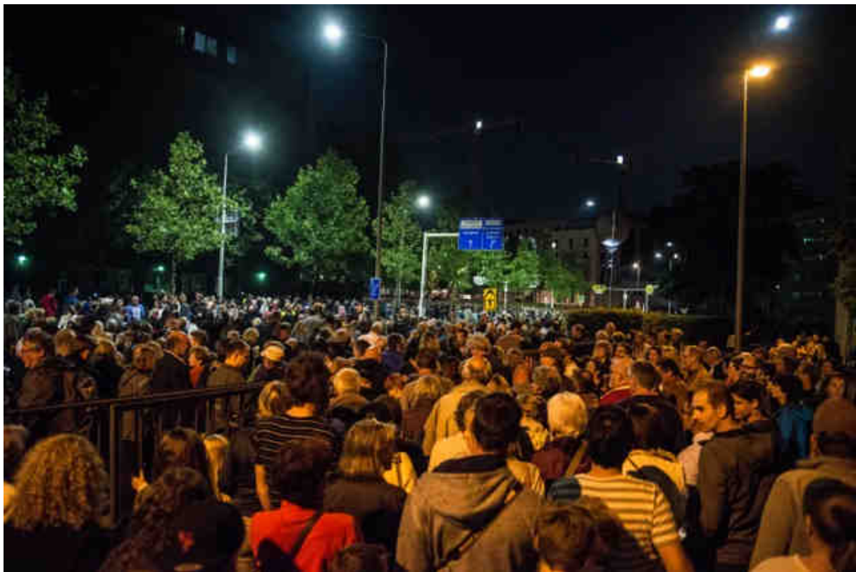
Publiek in parade terug naar het centrum van Heerlen aansluitend op de opening van Cultura Nova 2015

Internationale samenwerkingsverbanden zijn er met Across the Borders Festival (Aken), Stadttheater Aachen, Theater K Aachen, Kulturbetrieb Stadt Aachen, Haaste Töne Eupen, C-Mine Genk, Internationaal Straattheaterfestival Gent, Theater op de Markt Neerpelt / Hasselt, en gezelschappen zoals Walpurgis Antwerpen, Laika Antwerpen, Studio Orka Gent, Theater FroeFroe Antwerpen, Plasticiens Volants (Frankrijk), Groupe F (Frankrijk), Theatre de la Mezzanine (Frankrijk), PUJA (Spanje/Argentinië), Os Gemeos (Brazilië), Slava (Rusland).